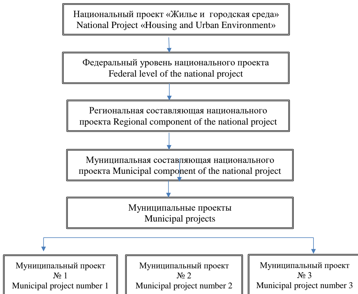
Рис. 2. Управление городской средой с использованием проектного подхода в рамках национального проекта «Жилье и городская среда»

Именно с учетом этих обстоятельств сегодня реализуются важнейшие проекты по улучшению городской среды. Речь идет о национальных проектах, которые призваны решать проблемы, жизненно важные для страны, региона, конкретной территории, отдельного человека. На каждом уровне управления проектами (федеральном, региональном, муниципальном) решаются вопросы, входящие в компетенцию органов соответствующего уровня управления. Применительно к национальному проекту «Жилье и городская среда» уровневая структура его реализации представлена на рис. 2.