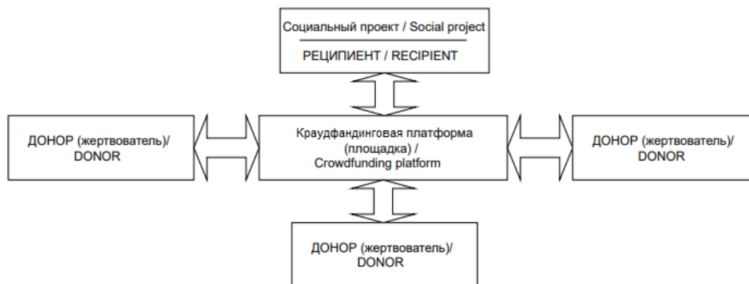
Рис. 1. Модель взаимодействия участников краудфандинговых отношений Fig. 1. Model of interaction of participants in crowdfunding relations

Краудфандинговые площадки представляют собой web-страницу, web-сайт или web-сервер, которые обеспечивают многоуровневую коммуникацию между реципиентом и донором. Под реципиентом подразумевается физическое или юридическое лицо, требующее финансовой помощи для реализации социально значимого проекта или конкретной каритативной помощи. Донорами (т. н. жертвователями) являются лица, которые направляют капиталовложения на развитие конкретной социальной программы или социального проекта.