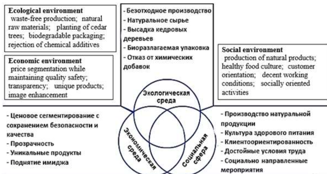
Рис. 2. Модель концепции этичного потребления в компании ООО «СибирьЭко»

ООО «СибирьЭко» – томская компания, которая производит натуральные продукты с опорой на экологическую и социальную ценности продукта, а также доступность для потребителя. С позиции методики триединой системы устойчивости (рис. 2) компания внедряет инновационные решения по производству экопродуктов, обеспечивая функционирование социальной подсистемы. Руководство компании обеспечивает условия и охрану труда на производстве. ООО «СибирьЭко» ищет способы для снижения вредного воздействия на окружающую среду в соответствии с экологической подсистемой. Что касается экономической сферы, компания уделяет меньше внимания данному вопросу и у нее имеются перспективы для развития в данном направлении.