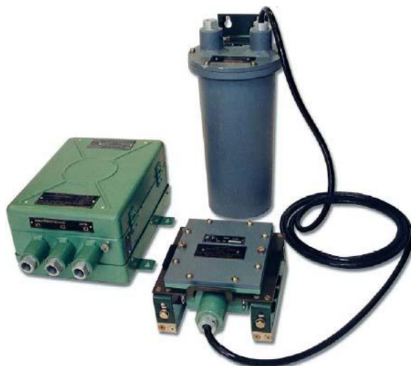
Рис. 1. Сигнализатор прохождения внутритрубных объектов СПРА-4