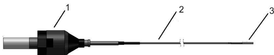
Рис. 2. Общий вид зондов электроимпульсного литотриптора

Рабочим инструментом для разрушения камней в мочевыделительной системе является изображенный на рис. 2 зонд, состоящий из электрического разъема (1), передающей части (2) и разрядной головки (3).