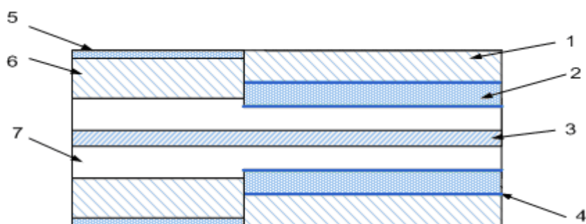
Рис. 3. Конструкция разрядной головки: 1 – внешний электрод; 2 – межэлектродная изоляция; 3 – жила коаксиального кабеля (внутренний электрод); 4 – цианоакрилатный клей; 5 – изоляция коаксиального кабеля; 6 – оплетка кабеля; 7 – изоляция жилы кабеля

В кювету, наполненную физиологическим раствором, на силиконовую подложку помещался модельный объект. Далее производилось его разрушение зондами конструкций 1 (рис. 3) и 2 (рис. 4). Разрушение производилось сериями по 10 импульсов с частотой импульсов в серии 5 Гц, энергия импульса 1 Дж.