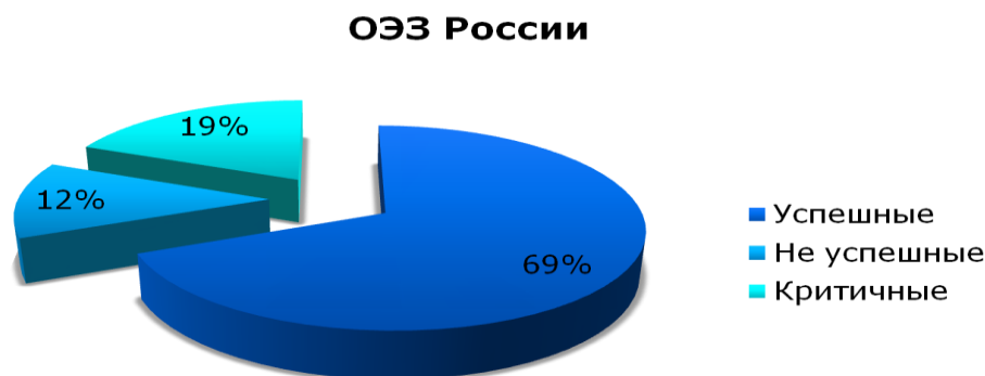
Рис. 1. Анализ состояния ОЭЗ в РФ

Однако, несмотря на всю привлекательность такого проекта, как ОЭЗ, в России существуют зоны, в которых не удалось реализовать задуманные цели и сейчас они либо закрыты, либо находятся на грани закрытия (наименования и причины закрытия представлены в табл. 3).