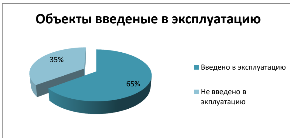
Рис. 3. Введение объектов в эксплуатацию [2]

В качестве причины можно выделить несоответствие срокам плана на всех уровнях. Планировалось ввести в эксплуатацию 223 объекта, тем не менее, введено всего 144, т. е 65 % (рис. 3). Работы выполнены на 73 млрд руб. государственных средств.