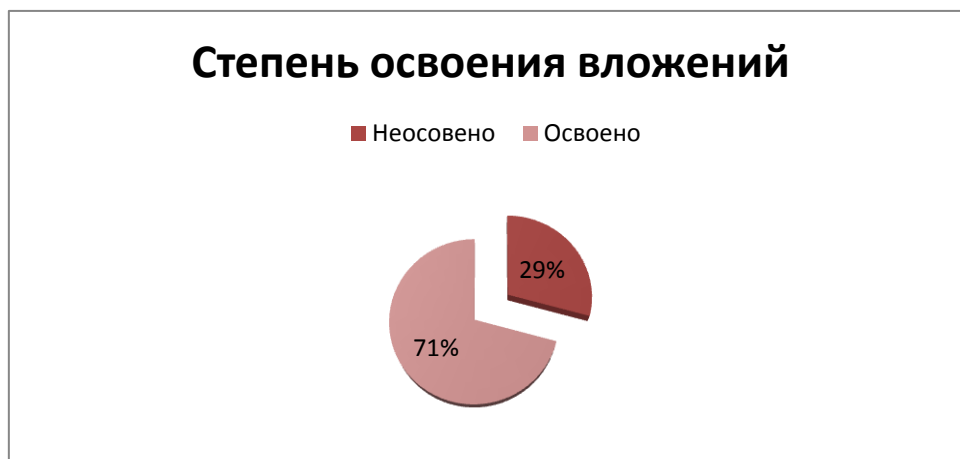
Рис. 2. Степень освоения вложенных средств, млрд руб. [2]

ва по долгосрочному развитию. Без строго целевой централизованной поддержки они практически неустойчивы, а господдержка российских ОЭЗ неэффективна. На 1 июля 2012 года федеральный и региональный бюджет выделил в совокупности 115,4 млрд руб. При этом еще 33,7 млрд руб. не освоено, из них 19,1 млрд не имеют установленных контрактных агентов, что свидетельствует о крайне низком уровне эффективности вложенных средств из государственной поддержки (рис. 2).