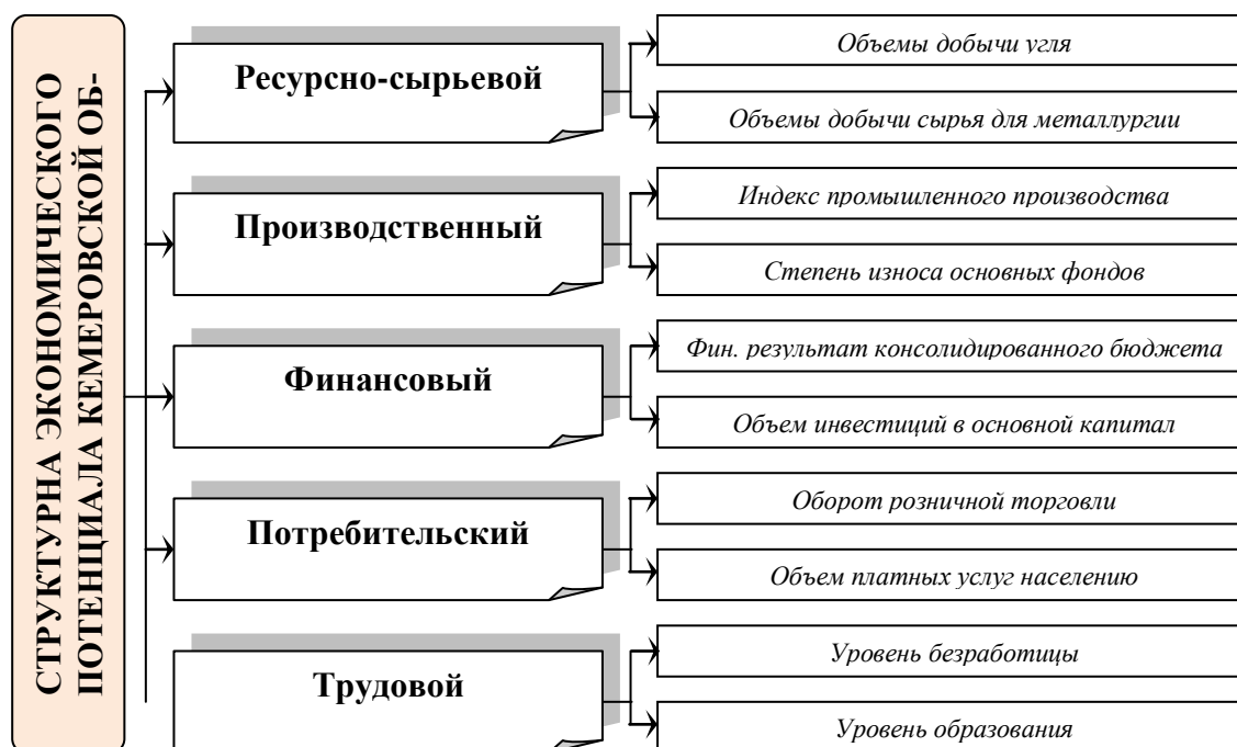
Рис 1. Структура экономического потенциала Кемеровской области

Показателями оценки ресурсно-сырьевого потенциала являются объемы добычи угля и объемов металлургии, т. к. для Кемеровской области это основные сырьевые ресурсы.