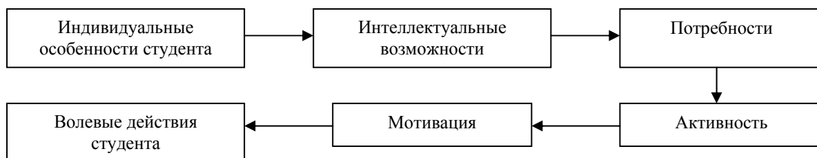
Рис. 2. Классификатор компонентов для формирования конкурентоспособного студента

Тем не менее развитие конкурентоспособной личности студента должно складываться из его личностно-деятельностных качеств и других методологических подходов. Важным аспектом решения проблемы формирования конкурентоспособного специалиста является наличие качеств личности. Более подробные аспекты взаимодействующих компонентов для развития конкурентоспособной личности представлены на рис. 2.