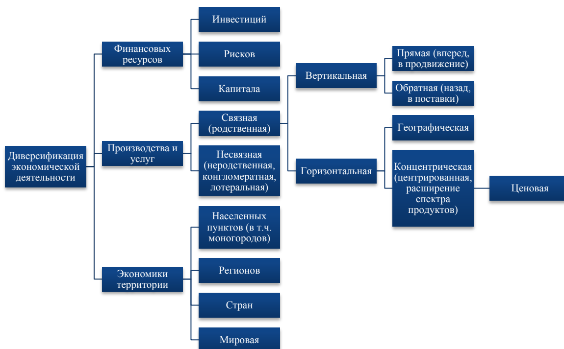
Рис. 1. Виды диверсификации