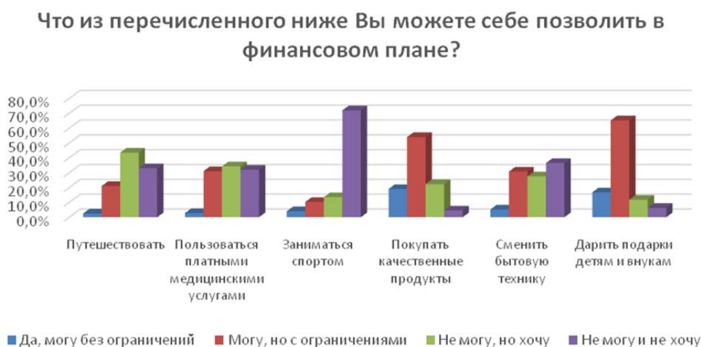
Рис. 2. Финансовые расходы по видам деятельности и услуг людей пожилого возраста

44 % респондентов не могут тратить на путешествия, но хотели бы путешествовать, если бы появилась такая возможность. Постоянно путешествуют без ограничений только 2 % респондентов и 21 % – путешествуют, но с ограничениями.