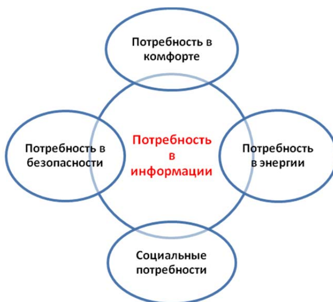
Рис. 1. Блоки потребностей благополучия человека

Используя устоявшуюся классификацию потребностей, предложенную А. Маслоу, и беря во внимание прогнозы относительно их трансформации в условиях современности (идеи П. Марша), выделим блоки потребностей благополучия индивида современного общества (рис. 1).