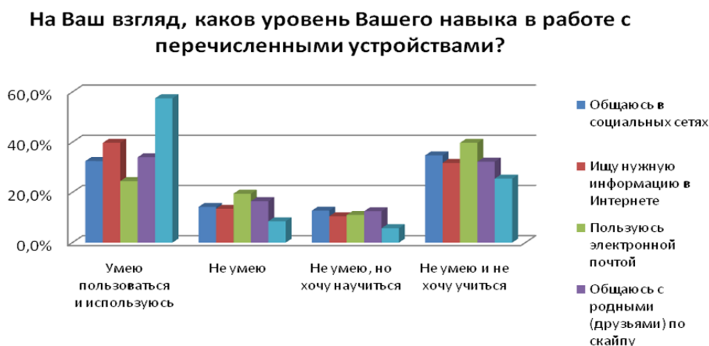
Рис. 4. Востребованность товаров и услуг современного софта среди людей третьего возраста

Анализ потребительской корзины через призму НТП и информатизации экономики также нашел отражение в опросе лиц старшего возраста. Полученные результаты (рис. 4) свидетельствуют о востребованности товаров и услуг современного «софта», пусть пока это и не абсолютное большинство по всем позициям, но можно сделать предположение, что полученное разделение мнений есть результат быстрого развития НТП с учетом становления потребительских привычек современного пенсионера в условиях отсутствия рассматриваемых товаров и услуг.