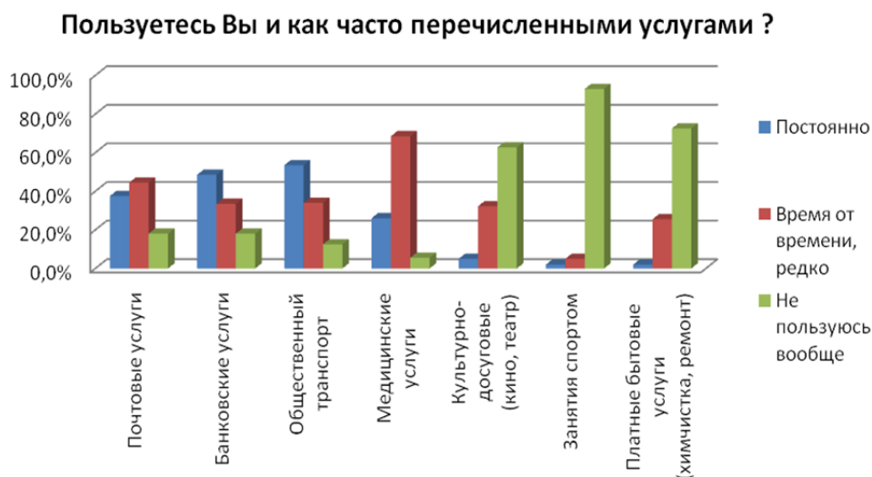
Рис. 3. Основные виды услуг

Выявлялось, какими услугами пользуются пожилые люди.